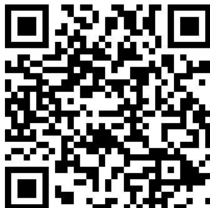
支付宝—山东税务社保费缴纳