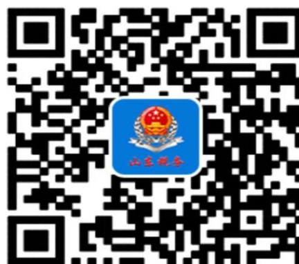
电子税务局手机 APP 二维码

抄送：市委办公室，市人大常委会办公室，市政协办公室，市纪委 办公室，市法院，市检察院，市人武部。